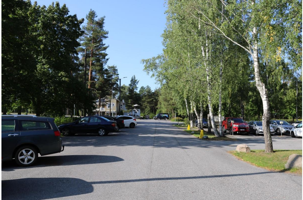
Ruotumestarintietä länteen kohti Nuhjalantietä.

Lähivirkistysalueita pidetään luonnontilaisina ja niihin tehdään tarvittaessa metsänhoidollisia toimenpiteitä.