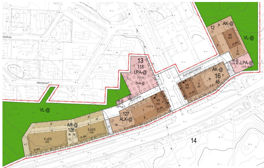
Ote nähtävillä olleesta asemakaavaluonnoksesta. Kartta ei ole mittakaavassa.

Yleisö- ja keskustelutilaisuuksista saatiin suullisia mielipiteitä, ks. liite 7, valmisteluvaiheen kuuleminen, lausunnot, ja niiden vastineet sekä lausuntojen vaikutukset kaavaan.