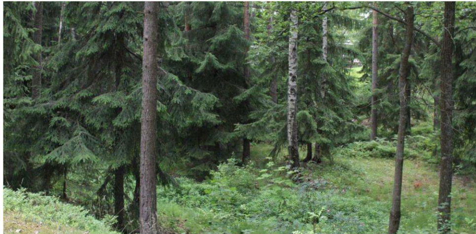
Rehevä notkelma suunnittelualueen vieressä länsipuolella.

Kunnalliset palvelut sijaitsevat lähituntumassa: