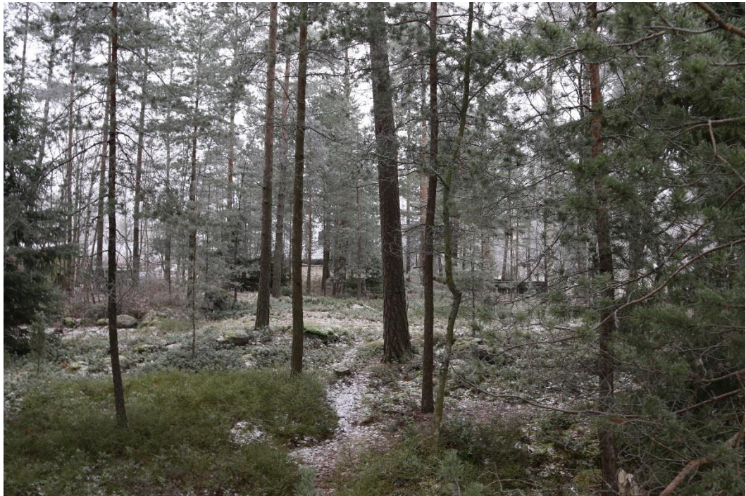
Suunnittelualue kuvattuna Aurinkotien suunnalta Mäntypuistossa.

Käyttötarkoituksalueiden pinta-alat ja rakennusoikeuserittely, ks. liite 1, asemakaavan seurantalomake.