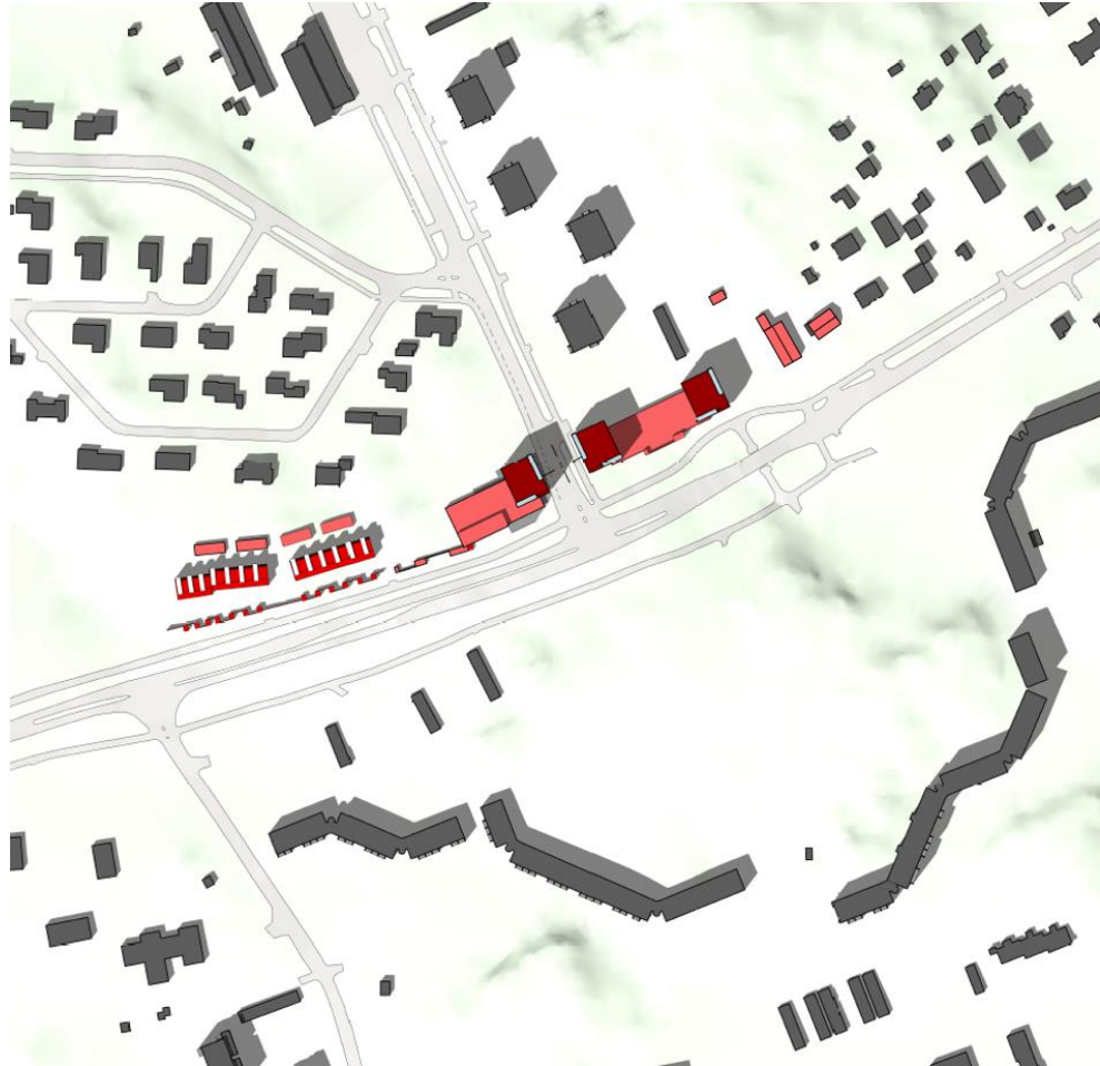
Ehdotusvaiheen havainnepiirustus suunnittelualueelta ja sen lähiympäristöstä.

Kaava-alueen toteutuminen tiivistää Manner-Naantalin pohjoisten osien yhdyskuntarakennetta.