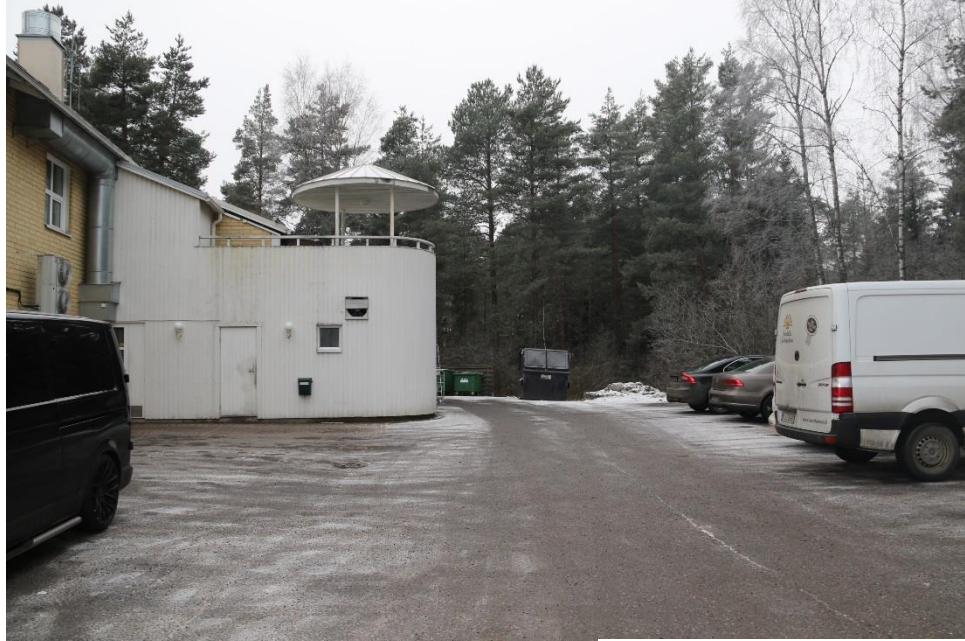
Ruotupihan tuleva katulinjan kohta kuvattuna länteen.