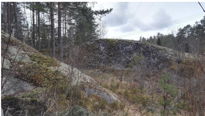
Kuvassa alueen kalliomuotoja.

Luontoselvitys asetti suunnittelulle suuntaviivoja, samoin maiseman tarkempi havainnointi. Alueen kalliomuotojen säilyttäminen nostettiin tärkeäksi tavoitteeksi suunnittelussa.