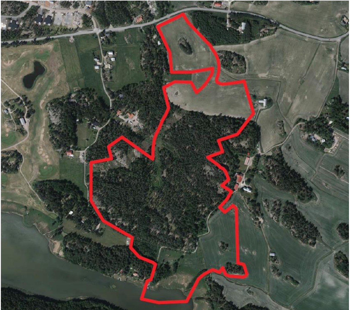
Ilmakuva alueesta, alareunassa Matalahti, yläreunassa Särkänсалmentie

Asemakaavan selostus 14.11.2018 (asemakaavakartta päivätty 7.11.2018)