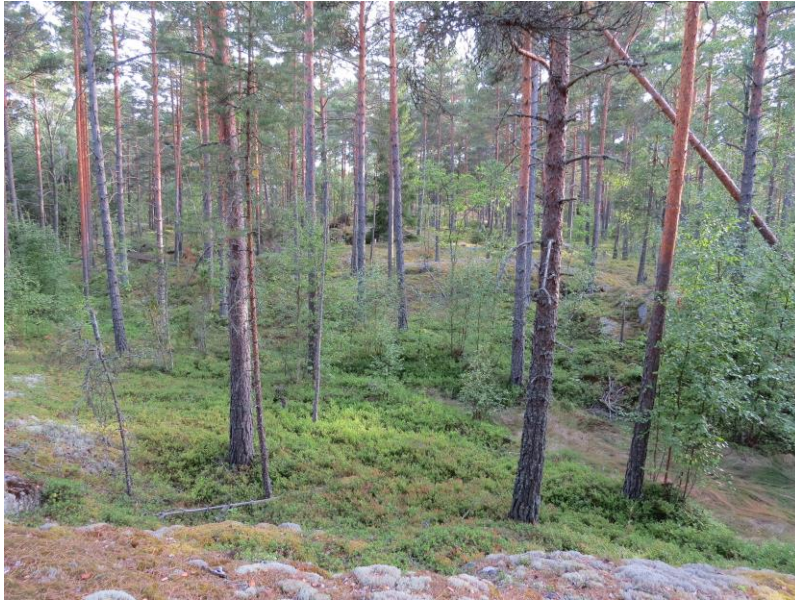
Kuva 6. Kuvio 11 on mäntyvaltaista kangasmetsää.