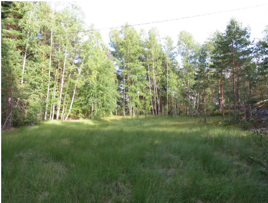
Kuva 1. Toinen Rauhalan suolaikuista.

Maankäyttösuositus: Suolaikut ovat luonnontilaisia ja edustavia metsälain tarkoittamia vähäpuustoisia soita. Ne tulee jättää ojittamatta ja rakentamatta, eikä niiden kautta pidä ajaa esimerkiksi metsäkoneilla.