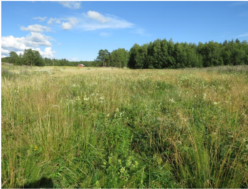
Kuva 5. Kuvio 3 Matalahden pohjoispuolella on entistä peltoa.

sylvestris ), kurjenkello, nokkonen ( Urtica dioica ), nurmipuntarpää, tuomi ja tienpientareella keltamataralta näyttävä matara. Tien mutkassa kasvaa kaksi noin kuusi metriä korkeaa, melko pylväsmäistä, katajaa.