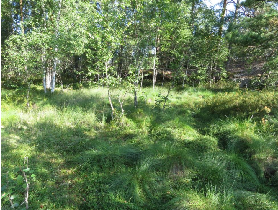
Kuva 2. Voimalinjan viereinen suolaikku.