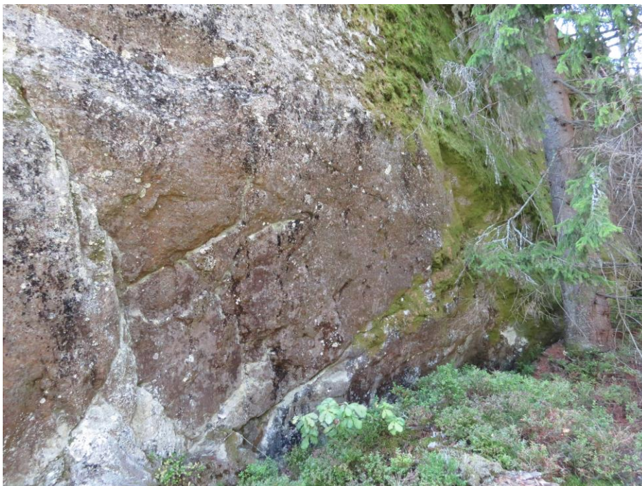
Kuva 3. Inttilän länsipuolen jyrkänteen kallioseinämää.

Maankäyttösuositus: Peltosaarekkeet olisi hyvä säilyttää rakentamattomina sekä huolehtia niitty- ja ketolaikkujen säilymisestä raivaamalla tarvittaessa puustoa ja pensaita. Varsinkin eteläisempi saareke sopisi uhanalaisen palosirkan elinympäristöksi, ja lajin esiintyminen siellä on mahdollista, vaikkei sitä tässä työssä havaittukaan.