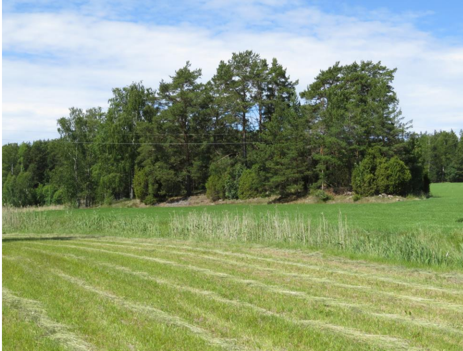
Kuva 4. Matalahden pohjoispuolen eteläisempi peltosaareke.

Maankäyttösuositus: Painanne lisää paikallisesti luonnon monimuotoisuutta, ja se olisi hyvä jättää rakentamatta ja kunnostusojittamatta. Kohteen läpi ei tulisi ajaa esimerkiksi metsäkoneilla.