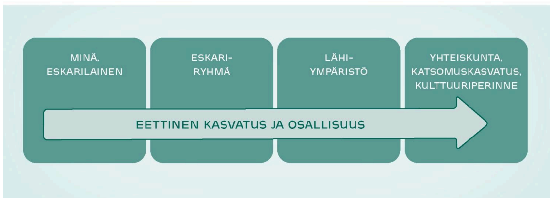
Eettinen kasvatus ja osallisuus