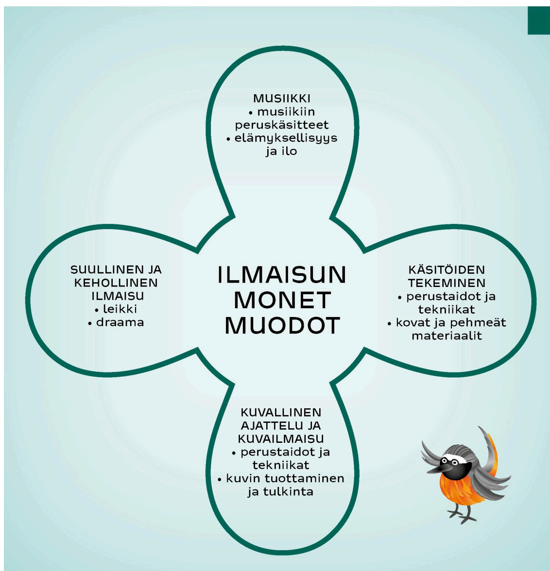
Ilmaisun monet muodot

Naantalin esiopetusyksiköt sijaitsevat erilaisissa ympäristöissä. Suurin osa sijaitsee kaupunkimaisessa, rakennetussa ympäristössä ja muutamat maaseutumaisemaisessa saaristolaisympäristössä. Tämä tuo leimansa kasvu- ja oppimisympäristöön, lapsen oppimaan oppimiseen ja opetustilanteiden järjestämiseen. Esiopetuksessa työskenteleviltä aikuisilta edellytetään sensitiivistä lapsen kohtaamista; kuuntelevaa, hyväksyvää, innostavaa ja rohkaisevaa suhtautumista lapseen ja hänen ilmaisuunsa. Aikuiset sallivat kaikenlaiset tunteet ja auttavat lasta käsittelemään ja nimeämään niitä. Kaikki ilmaisu todentuu lapsen leikissä, Aikuisen tehtävä on rikastuttaa leikkiä ja tarjota monipuolisia materiaaleja, tekniikoita ja elämyksiä. Naantalissa näitä elämyksiä tarjoavat esimerkiksi erilaiset konsertit, teatterit ja taidenäyttelyt, kirkot, museot, paikalliset kulttuuriperinteet, puhdas luonto ja metsä. Toisten lasten ja ryhmien pienet esitykset ja näyttelyt ovat myös erittäin tärkeitä ja antoisia esikoululaisille. Osana kulttuuriväylää järjestämme vuosittain taidetaivalluksen, joka toteutetaan yhdessä paikallisten yrittäjien kanssa. Vieraillemme vuosittain myös Turun kaupunginorkesterin konsertissa ja teemme museokäynnin valinnaisessa museossa.