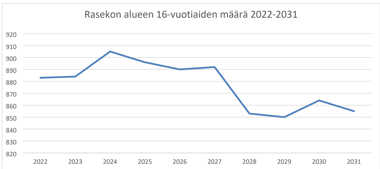
Taulukko 2. Rasekon alueen 16-vuotiaiden määrän kehitys 2022-2031.