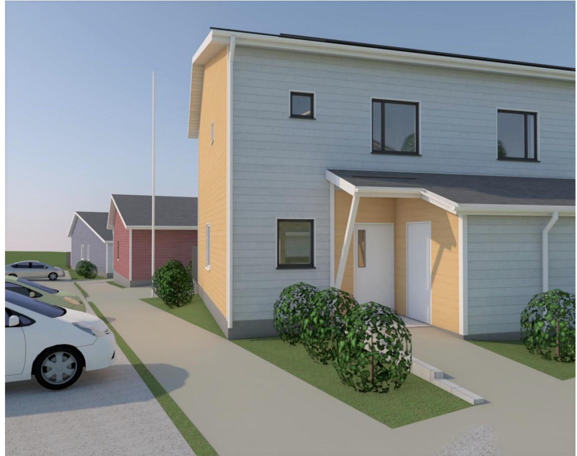
Alustava havainnekuva Torpparintie 7 taloista