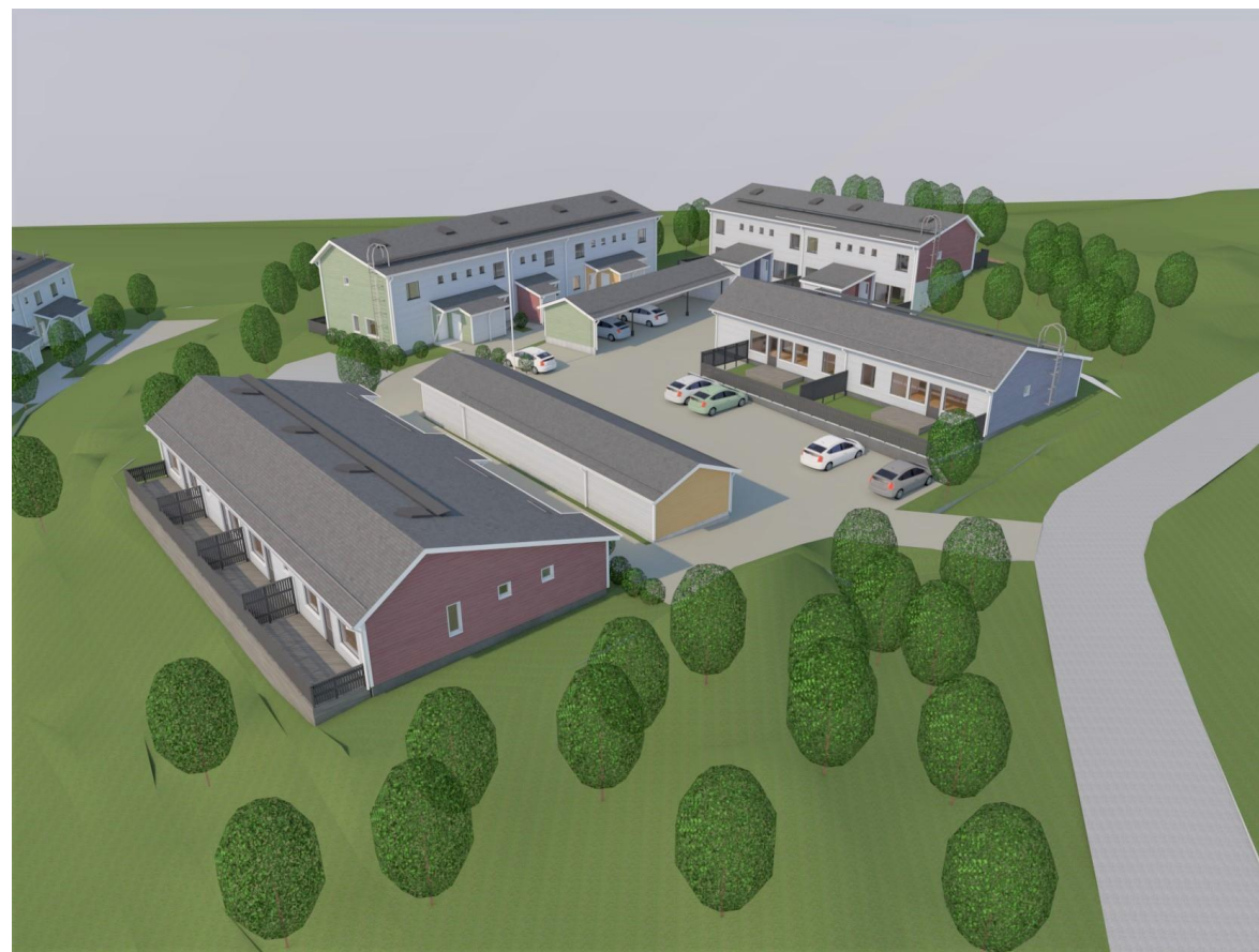
Alustava havainnekuva Juhoniemenkatu 2 taloista