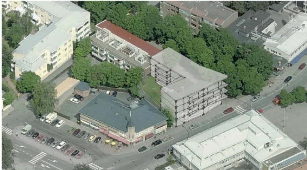
Kuva 4, ”taiteilijan näkemys”

15.10.2013 vaihtoehto 1:den suunniteltu kerrosala on ~2170 m 2 .