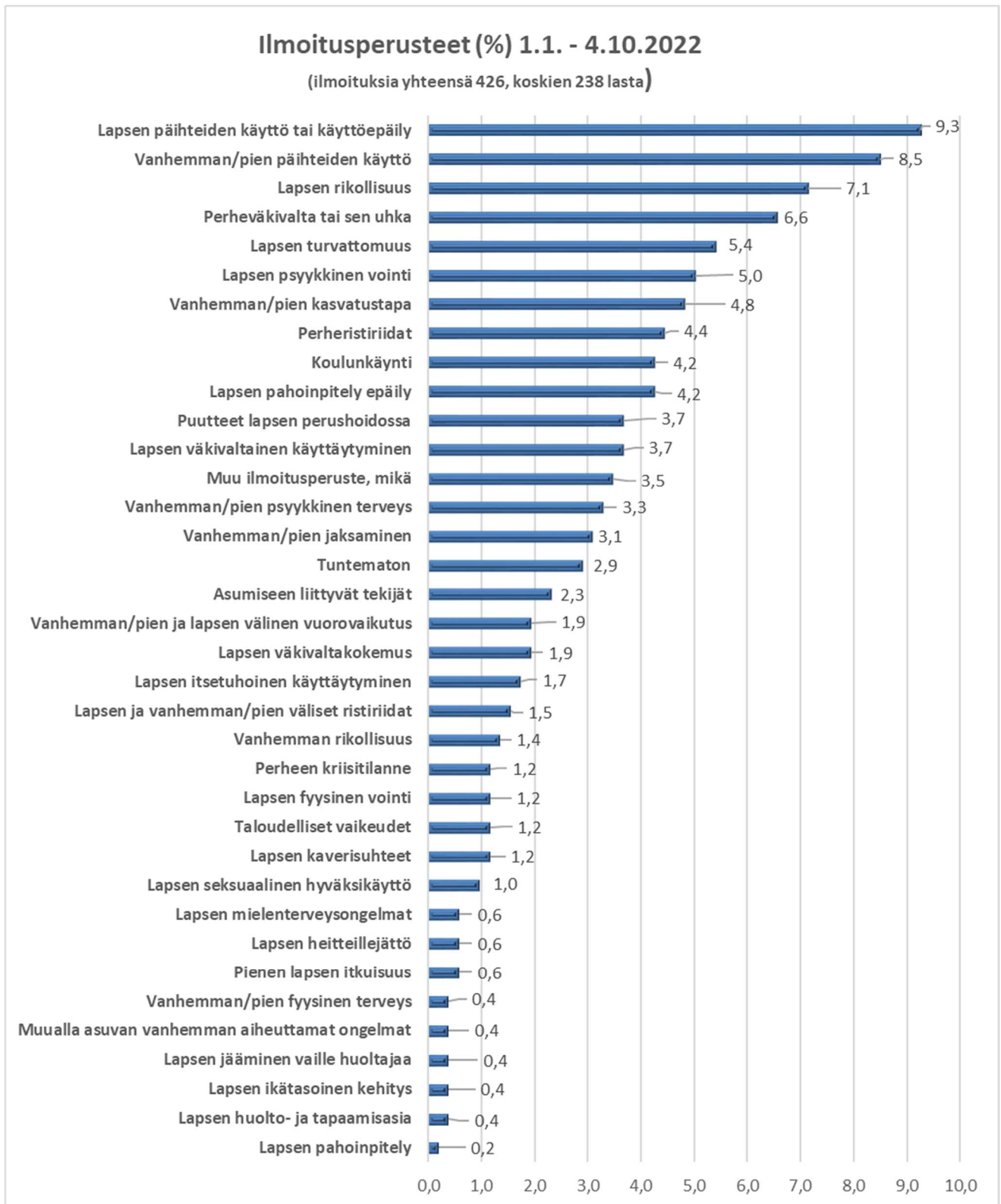
Kaavio: Lastensuojeluilmoitusten perusteet ajalla 1.1. – 4.10.2022, %

Kuten aiempinakin vuosina yleisimpiä ilmoitusten tekijätahoja olivat poliisi, sosiaalipäivystys, koulut ja terveydenhuolto. Nuorten koulunkäyntiin liittyen huolta on kevät lukukautena herättänyt koulunkäynnistä syrjäytymisvaarassa olevien nuorten määrän kasvu. Näiden nuorten tukemiseksi on tehty enenevästi yhteistyötä sosiaali-, terveys- ja sivistyspalvelujen kesken.