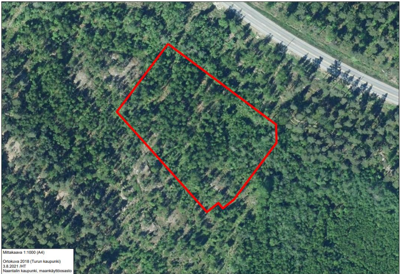
Ortoilmakuva kohteen kerrostalotontista vuodelta 2018. Alueelle on nykyisin toteutettu kunnallistekniikkaa ml. teitä.