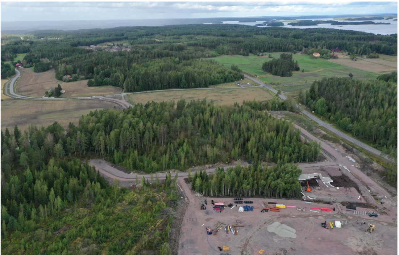
Viistoilmakuva alueesta syksyltä 2021