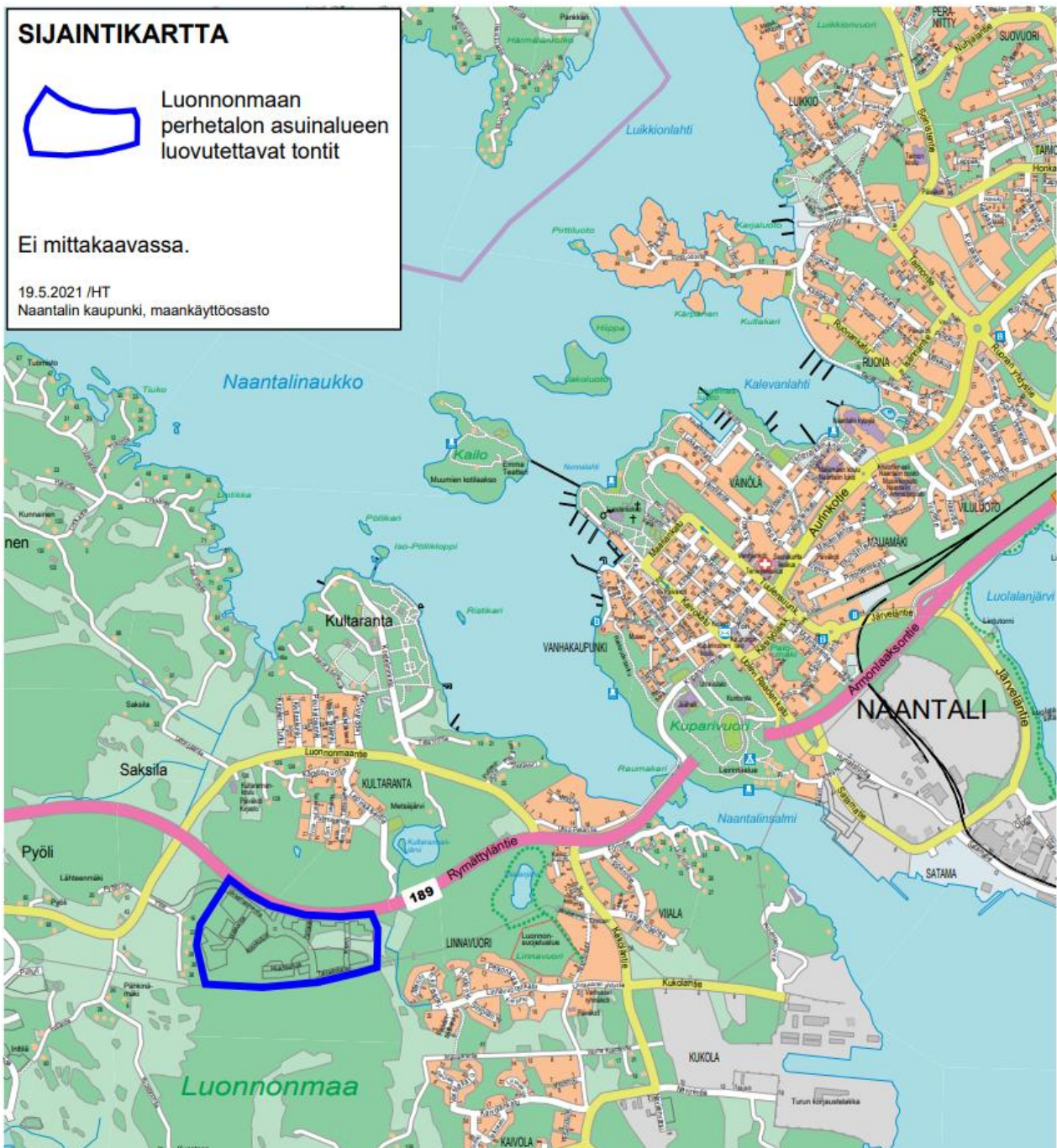
Luonnonmaan perhetalon / Aurinkotuulen asuinalueen sijaintikartta.

Kohde sijaitsee Naantalin Luonnonmaalla Rymättylätien eteläpuolisen asuntoalueen ja Luonnonmaan perhetalon asemakaavan asemakaava-alueella Naantali-Rymättylä seututien eteläpuolella. Asemakaava mahdollistaa asuinrakentamisen, perhetalokokonaisuuden (päiväkotu, koulu ja muita palveluja) sekä kaupallisten palvelujen rakentumisen alueelle. Alueelle on valmistumassa päivittäistavarakauppa ja polttoaineenjakoasema vuoden 2022 aikana. Rakenteilla olevan perhetalon on määrä valmistua vuoden 2023 aikana. Alueelta syksyllä 2021 ensimmäisessä vaiheessa luovutettava olleet AO-tontit (13 kpl) ja AP-tontit (3 kpl) on kaikki varattu. Saman myyntikierroksen jäljiltä on varattu myös yksi AK-tontti, jolle on tulevaisuudessa rakentumassa valtion tuella toteutettavia asuin-oikeusasuntoja. Em. kohteiden luovutuksista on päätetty vuoden 2021 aikana.