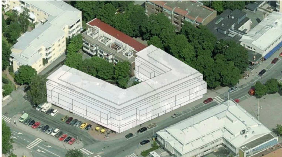
Kuva 5, ”taiteilijan näkemys”

6.9.2017 päivätyissä suunnitelmissa on Birgitan talon kiinteistölle 529-2-31-7 sekä Koy Naantalin Keskusaukion kiinteistölle 529-2-31-8 esitettiin uutta maankäyttöä. Hanke oli suunniteltu siten, että kiinteistöt voidaan rakentaa eri vaiheissa. Rakennuksissa oli kolme kerrosta ja ullakkokerros sekä kellarikerros pysäköintiä varten. Katutasoon on sijoitettu liikehuoneistoja Tullikadun ja Kaivokadun suuntaan. Suunnitelmassa on myös esitetty kiinteistölle 529-2-31-9 lisärakentamista uuden ullakkokerroksen verran.