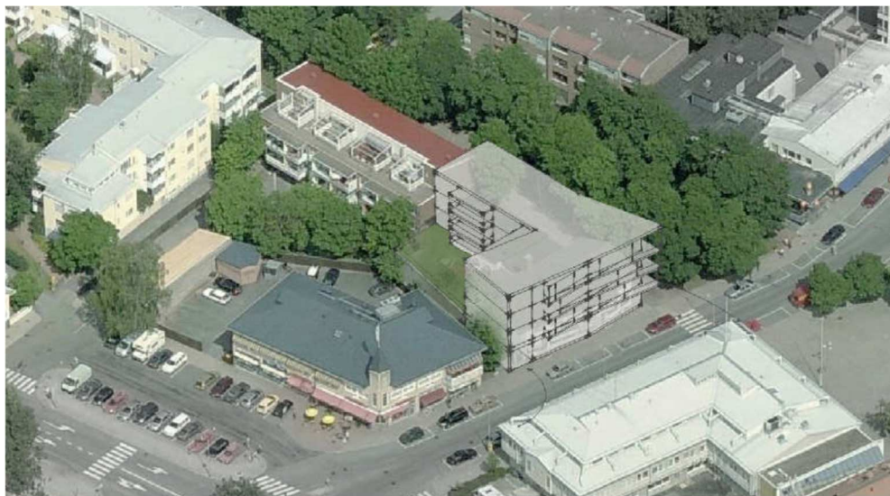
Kuva 4, ”taiteilijan näkemys”

15.10.2013 päivätyissä suunnitelmissa on Birgitan talon kiinteistölle 529-2-31-7 kolme vaihtoehtoa. Suunnitelman versioissa 1 ja 2 on neljä kerrosta ja maanalainen kellarikerros, jossa on rakennuksen kellaritiloja ja/tai auto paikoitusta. Versiossa 3 on viisi maanpäällistä kerrosta sekä maanalainen pysäköintikerros. Suunnitelmassa on myös esitetty kiinteistölle 529-2-31-9 lisärakentamista lisäullakkokerroksen verran.