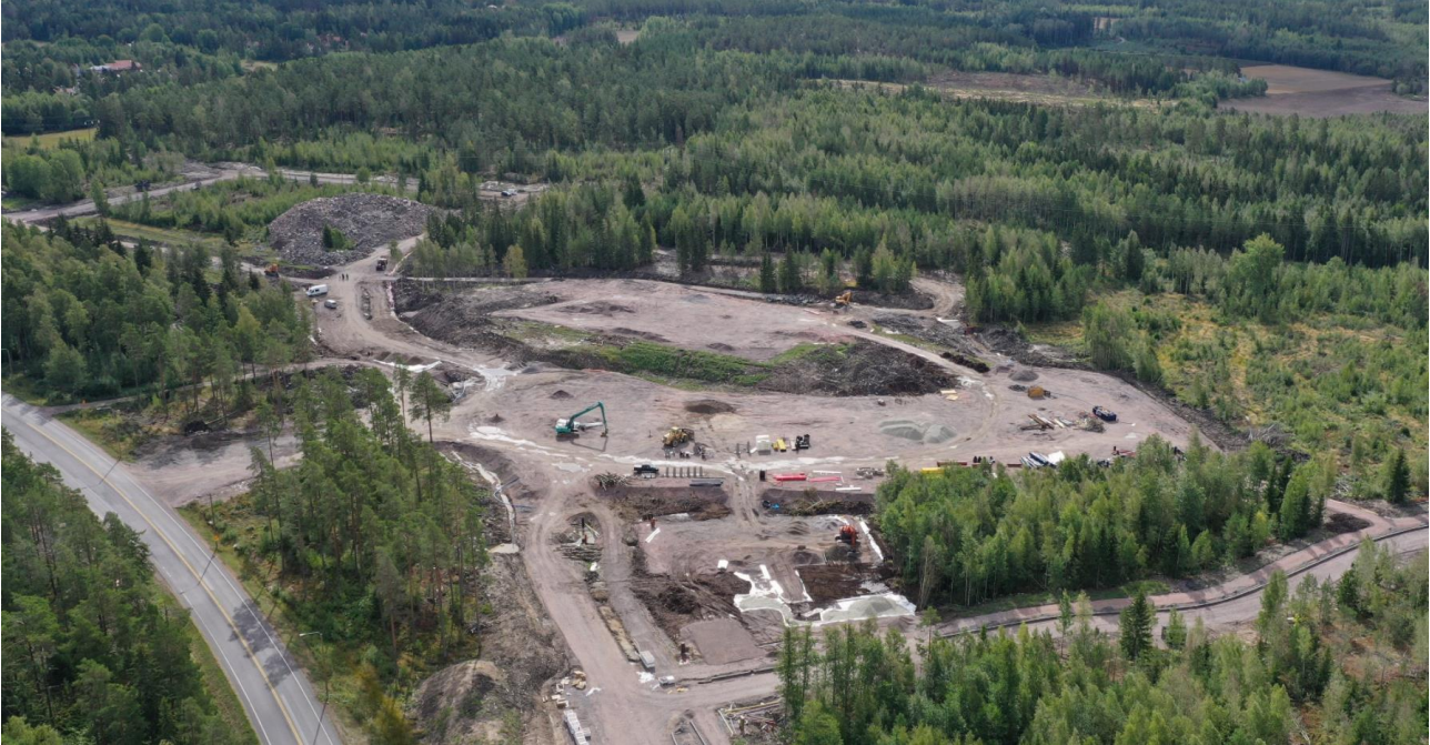
Viistoilmakuva alueesta syksyiltä 2021

Alue on Luonnonmaan saaren keskellä, linnuntietä mitattuna noin 2 kilometrin etäisyydellä Naantalin keskustasta. Lähialueen nykyisistä palveluista tärkeimmät ovat Kultarannan koulu (etäisyys 0,5 km), Linnavuoren päiväkoti (suunnittelualan reunalla) sekä keskustan palvelut (alle 2 km). Kultaranta Resortin palvelut ovat noin kahden kilometrin etäisyydellä. Alue on myytävien tonttien osalta tyypillistä kallioista metsäaluetta, jonka topografia vaihtelee.