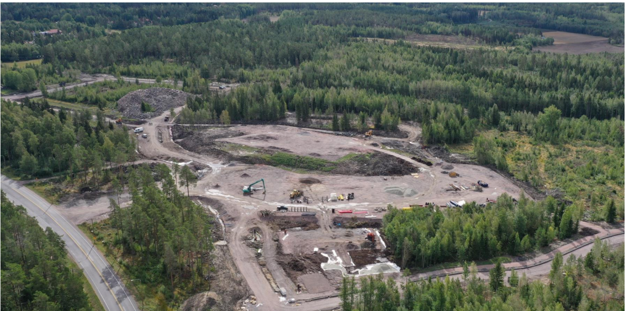
Viistoilmakuva alueesta syksyiltä 2021

Alue on Luonnonmaan saaren keskellä, linnuntietä mitattuna noin 2 kilometrin etäisyydellä Naantalin keskustasta. Lähialueen nykyisistä palveluista tärkeimmät ovat Kultarannan koulu (etäisyys 0,5 km), Linnavuoren päiväkoti (suunnittelualan reunalla) sekä keskustan palvelut (alle 2 km). Kultaranta Resortin palvelut ovat noin kahden kilometrin etäisyydellä. Alue on myytävän tontin osalta tyypillistä kallioista metsäaluetta, jonka topografia vaihtelee.