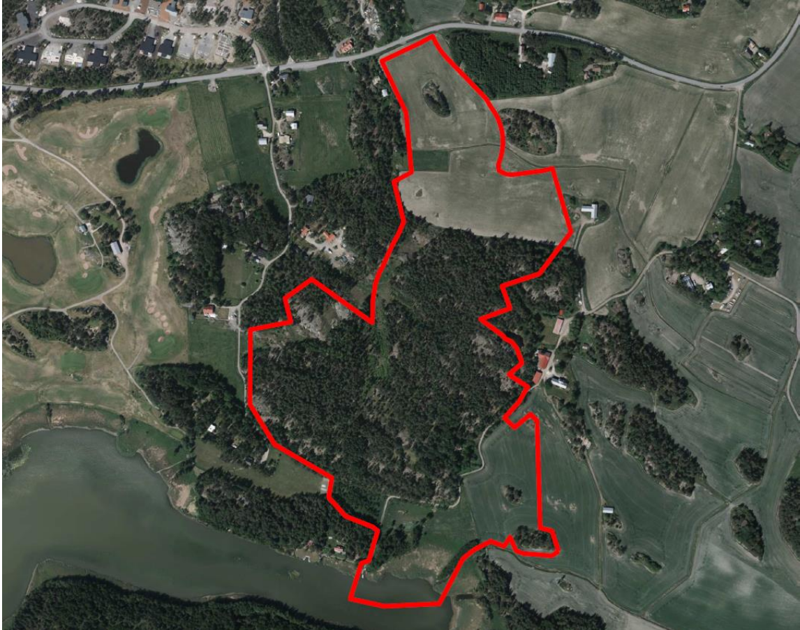
Ilmakuva alueesta, alareunassa Matalahti, yläreunassa Särkänsalmentie